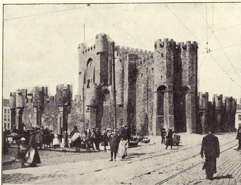
Gand. — Le Château des Comtes.